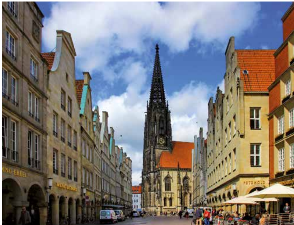
Prinzipalmarkt in Münster.

Der St.-Paulus-Dom hat eine herausragende Bedeutung. Im Herzen der Stadt symbolisiert er das Zentrum der Diözese Münster. Als Bischofs-, Haupt- und Mutterkirche des Bistums sowie als kunst- und kulturhistorisch bedeutsames Bauwerk ist der Paulusdom Anziehungspunkt zugleich für Gläubige wie Touristen. Hier wird Pfr. Dr. Schneider uns in einer Führung einige herausragende Schätze näherbringen.