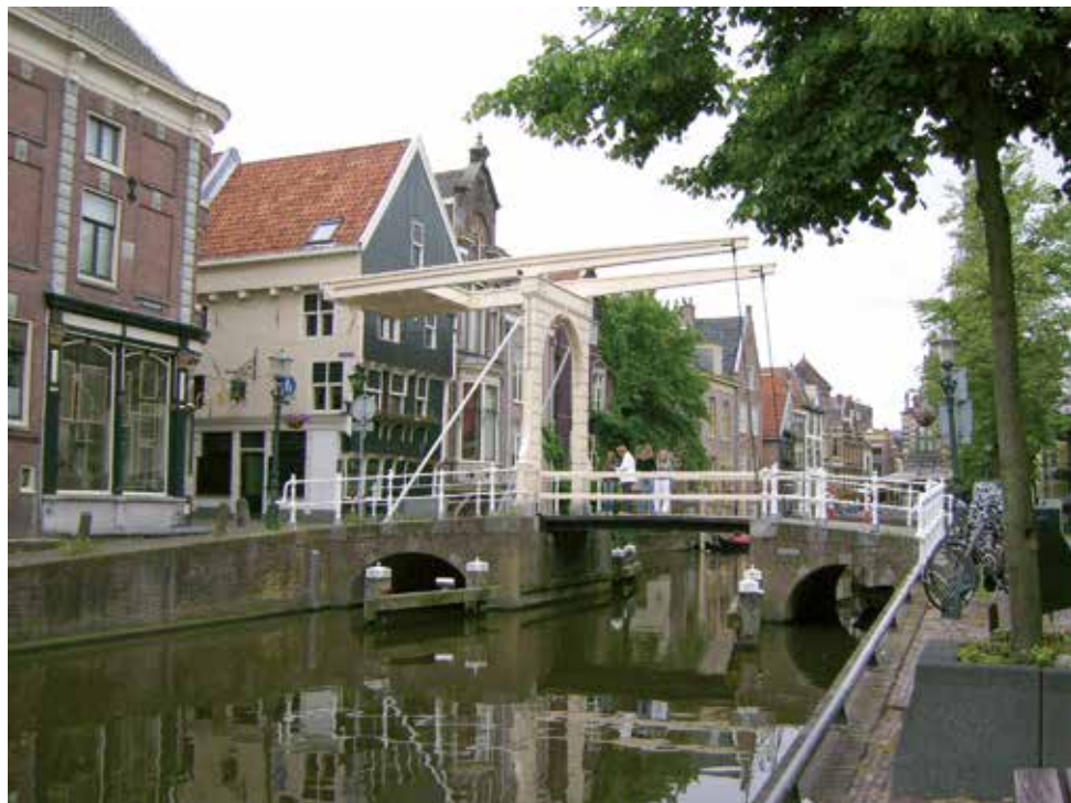
Klappbrücke in Alkmaar.

Das erste Ziel unserer Tagesfahrt ist eines der am meisten geschätzten Museen in Amsterdam. Auf dem Dachboden einer Grachtenvilla verbirgt sich ein Geheimnis. Und zwar eine katholische Kirche aus dem 17. Jahrhundert. Sie wurde im Verborgenen errichtet, da die Katholiken